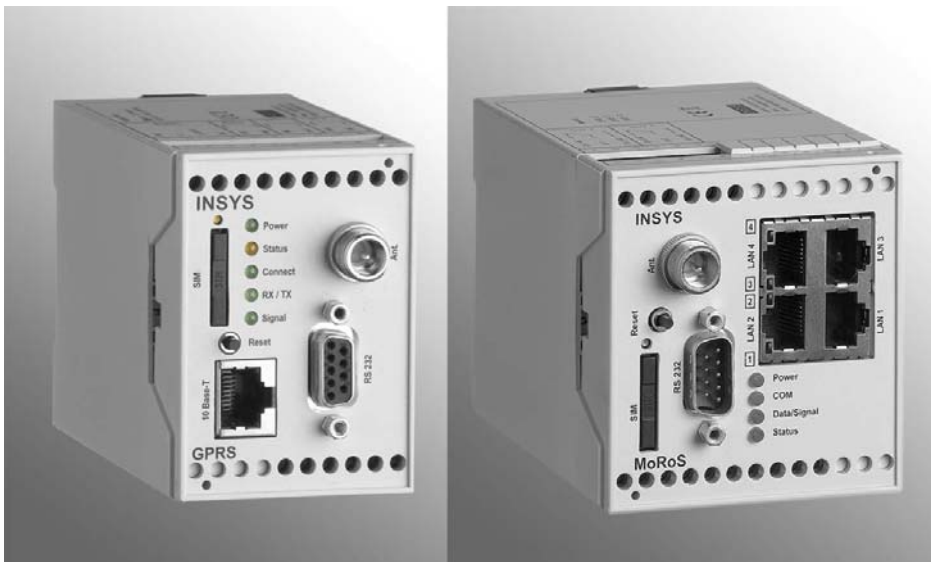
Bild 2: Mit den Mobilfunk-Modems und -Routern von INSYS, wie z. B. mit INSYS GPRS (links) oder mit MoRoS GPRS (rechts), lassen sich kostengünstige virtuelle Standleitungen einrichten.

INSYS bietet zur Verwirklichung der drahtlosen Standleitung gleich mehrere Lösungen: Mit den Mobilfunk-Modems und -Routern der Baureihen INSYS GPRS und MoRoS lassen sich virtuelle Festverbindungen über die öffentlichen Mobilfunknetze einrichten. Auf dieser Grundlage können sehr kostengünstige Quasi-Standleitungen realisiert werden, da bei der Abrechnung der paketvermittelten Datendienste GPRS, EDGE und UMTS nur das übermittelte Datenvolumen (Traffic) abgerechnet wird. EDGE und UMTS haben geringe Signallaufzeiten und eignen sich daher besonders für zeitkritische Anwendungen. Das Modem INSYS GPRS serial verhält sich für eine Applikation mit RS232-Schnittstelle wie ein herkömmliches Modem und leitet die Daten transparent durch das Mobilfunk-Netz.